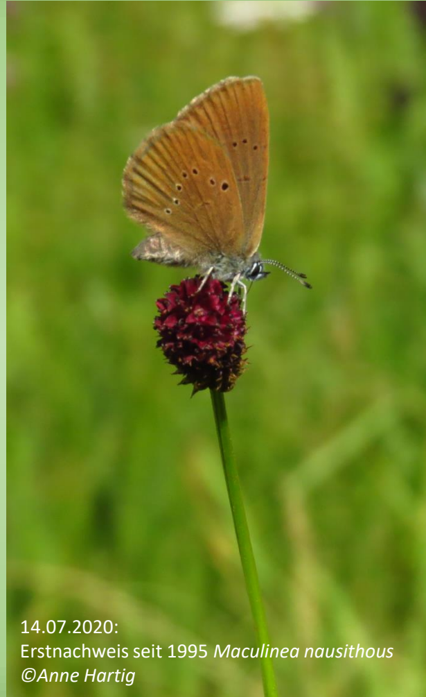
14.07.2020: Erstnachweis seit 1995 Maculinea nausithous