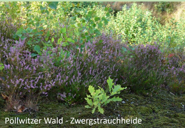
Pöllwitzer Wald - Zwergstrauchheide