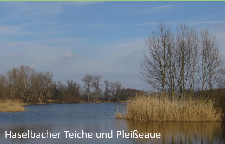
Haselbacher Teiche und Pleißeau